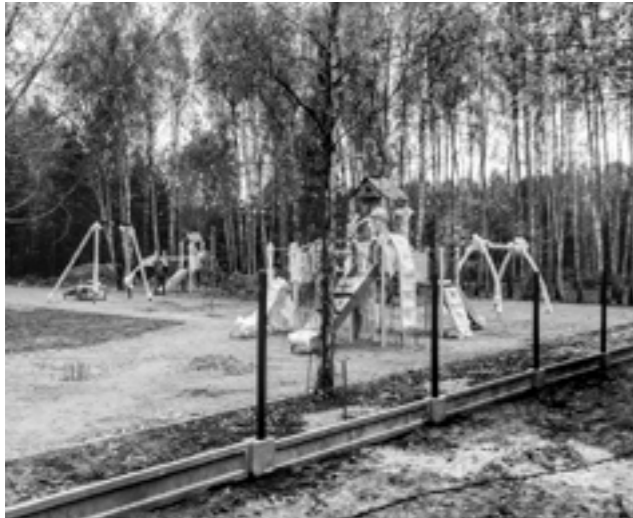
Montaż urządzeń na placu zabaw

W Strzeniówce przy ul. Działkowej trwają prace związane z zagospodarowaniem terenu zewnętrznego w zakresie małej architektury. W ramach tego zadania powstanie między innymi plac zabaw z nawierzchnią bezpieczną wraz z ogrodzeniem, Flowpark. Powstanie też teren rekreacyjno-parkowy wraz z alejkami i elementami małej architektury.