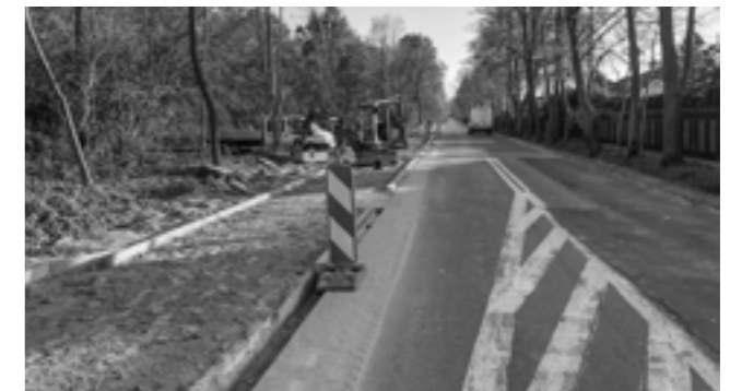
ul. Nad Utratą w Walendowie