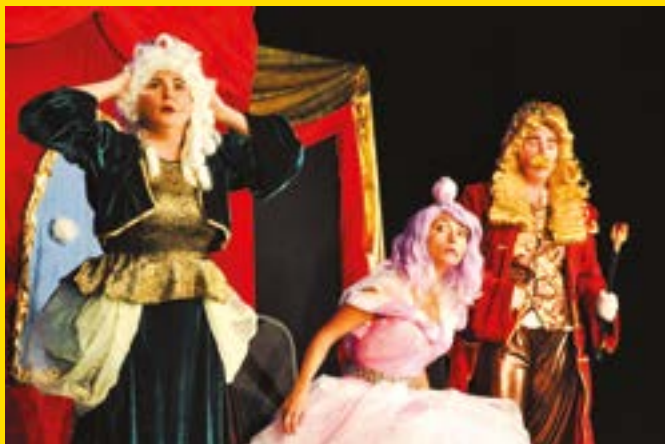
Teatrzyk w walizce Baśń o leciutkiej królownie