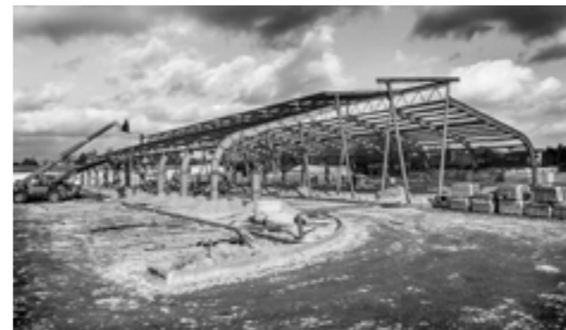
Trwa montaż konstrukcji stalowej zadaszenia peronu autobusowego realizowanego w ramach Parkuj i Jedź