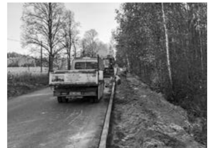
Budowa odcinka Młochów-Krakowiany