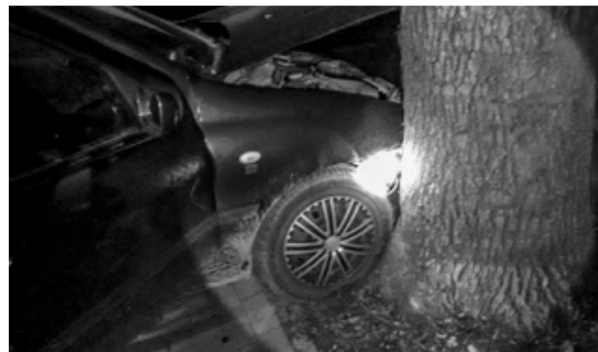
fot. OSP Nadarzyn (2)