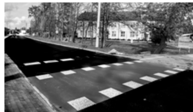
Zakończyła się przebudowa ul. Granicznej

Zaprojektowanie i budowa parkingu w ramach projektu Parkuj i Jedź w Gminie Nadarzyn realizowana ramach Działania 4.3 Redukcja emisji zanieczyszczeń powietrza, Poddziałania 4.3.2 Mobilność miejska w ramach ZIT, Typu projektów: Rozwój zrównoważonej multimodalnej mobilności miejskiej – „Parkingi Parkuj i Jedź” Regionalnego Programu Operacyjnego Województwa Mazowieckiego 2014-2020