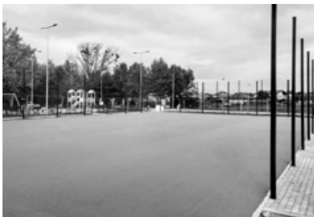
Budowa boiska w Wolicy