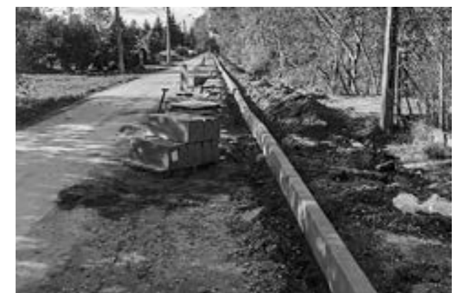
ul. Promyka w Urzucie

Zakończyła się budowa ścieżki rowerowej przy ul. Grodzkiej (na odcinku od trasy S8 do ul. Jemiółowej). Trwają prace związane z budową ścieżki rowerowej przy ul. Promyka w Urzucie, Nad Utratą w Walendowie oraz na odcinku Młochów-Krakowiany.