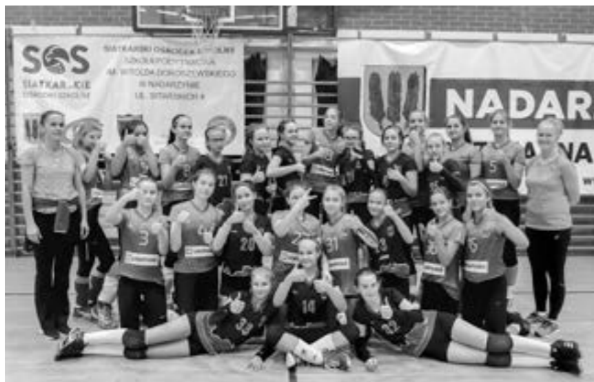
fot. GLKS Nadarzyn