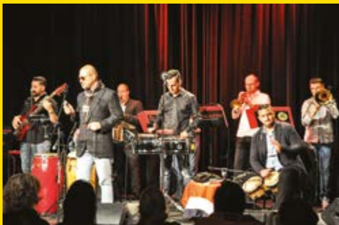
Koncert El Salsero