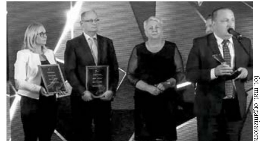
fol. mat. organizatora

W konkursie Lider Zmian nasz samorząd - w kategorii gmin wiejskich powyżej 5000 mieszkańców - zajął doskonale II miejsce. Wyprzedziła nas tylko gmina Pomiechówek. Ideą konkursu jest wyróżnienie ciekawych i wartościowych inicjatyw, które mają bezpośredni wpływ na polepszenie życia. Nagrodzone zostały instytucje, przedsiębiorstwa oraz samorządy (te ostatnie oceniano w zakresie dofinansowania z UE w przeliczeniu na mieszkańca). Wyróżnienie dla naszego samorządu oznacza, że w ciągu ostatnich dwunastu miesięcy pozyskaliśmy dużą ilość środków unijnych na realizację szeregu inwestycji.