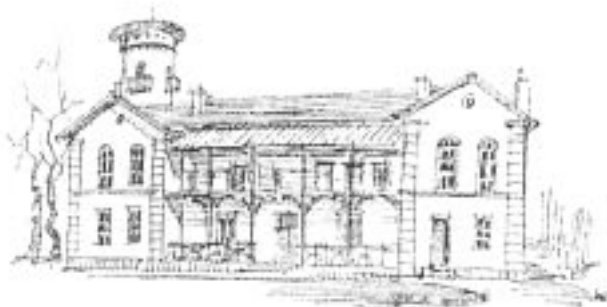
Architektura prawdziwie uniwersalna... Willa "Foksal" - dawny dworzec kolejowy w Grodzisku

miejską Grodziska Mazowieckiego. Grodzisk ma prawa miejskie od 1522 r. lecz okolica była zamieszkała już w pierwszych wiekach naszej ery. Pierwotna nazwa "Grodzisko" zapewne związana była z grodziskiem z XI w. znajdującym się wśród łąk nad Mrową, w pobliżu wsi Chlebnia. Grodzisk warto obejrzeć; dojście od stacji w Grodzisku Maz. ku północy (bez znaków) ulicami Traugutta Graniczną, Chlewińską (2,5 km). Obecnie miasto jest znaczącym ośrodkiem przemysłowym. W centrum kościół barokowy z II poł. XVII w., przebudowany, o wyposażeniu renesansowym i barokowym (liczne epitafia). — 19,0 km Grodzisk Maz. , dworzec PKP i PKS. W pobliżu budynek dawnego dworca kolei warszawsko-wiedeńskiej z poł. XIX w.