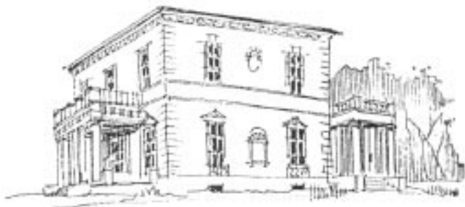
Dworek w Rozalinie - podobną budowlę można obejrzeć w warszawskich Łazienkach

Jaktorów (0,0 km) - Kuklówka (8,0 km) - Ojcówek (9,5 km) -