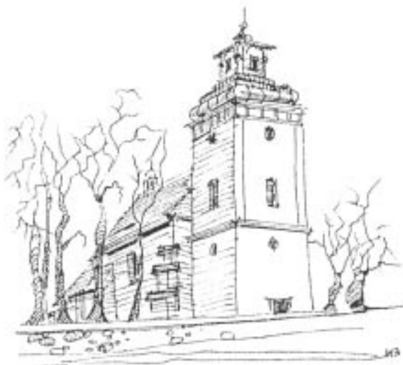
Opodal grobu malarza polskiej wsi Kościół w Żelechowie

28,5 km Gnojna, budynek szkoły pośród wysokich drzew. Niebawem stawy Gnojna. W otoczeniu pejzaż dolinki rozcina-