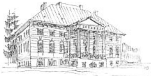
Pałac w Młochowie - jeden z najwybitniejszych przykładów klasycyzmu na Mazowszu

Trasa o dużych walorach krajoznawczych i krajobrazowych, o znaczeniu ponadregionalnym. Malowniczy pejzaż kulturowy łagodnie sfalowanej krawędzi Wysoczyzny Rawskiej, rozciętej dolinkami Utraty, Korczunka, Pisi Tuczej i Pisi Gągoliny, z kompleksami stawów rybnych i unikalnym na Mazowszu nagromadzeniem lasów liściastych, wśród których rezerwaty i pomniki przyrody. Miejsca o interesującej historii i zabytki architektury w Młochowie, Żelechowie, Skulach, Radziejowicach. Szlak godny polecenia zwłaszcza wiosną i wczesnym latem. Przydatny dla pieszych i kolarzy, zimą niełatwy w orientacji, przydatny dla narciarstwa śladowego.