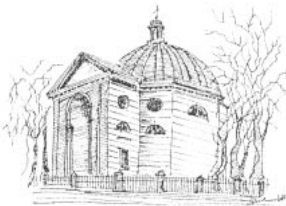
Dzielo jednego z mistrzów polskiego klasycyzmu Kościół w Radziejowicach

32,0 km Radziejowice, droga szybkiego ruchu Katowice - Warszawa, przystanek autobusowy (bezpośrednie kursy do War-