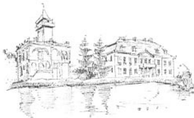
Neogotycki zameczek w sąsiedztwie barokowego pałacu

b. Za znakami żółtymi nadal lasem, krętą trasą, miejscami wąskimi drózkami wśród gęstwy krzewów. Drzewostan