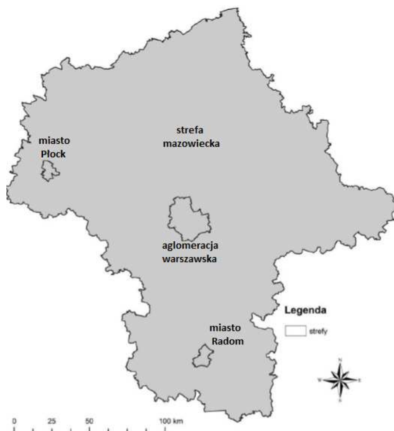
Rysunek 2 Podział województwa mazowieckiego na strefy