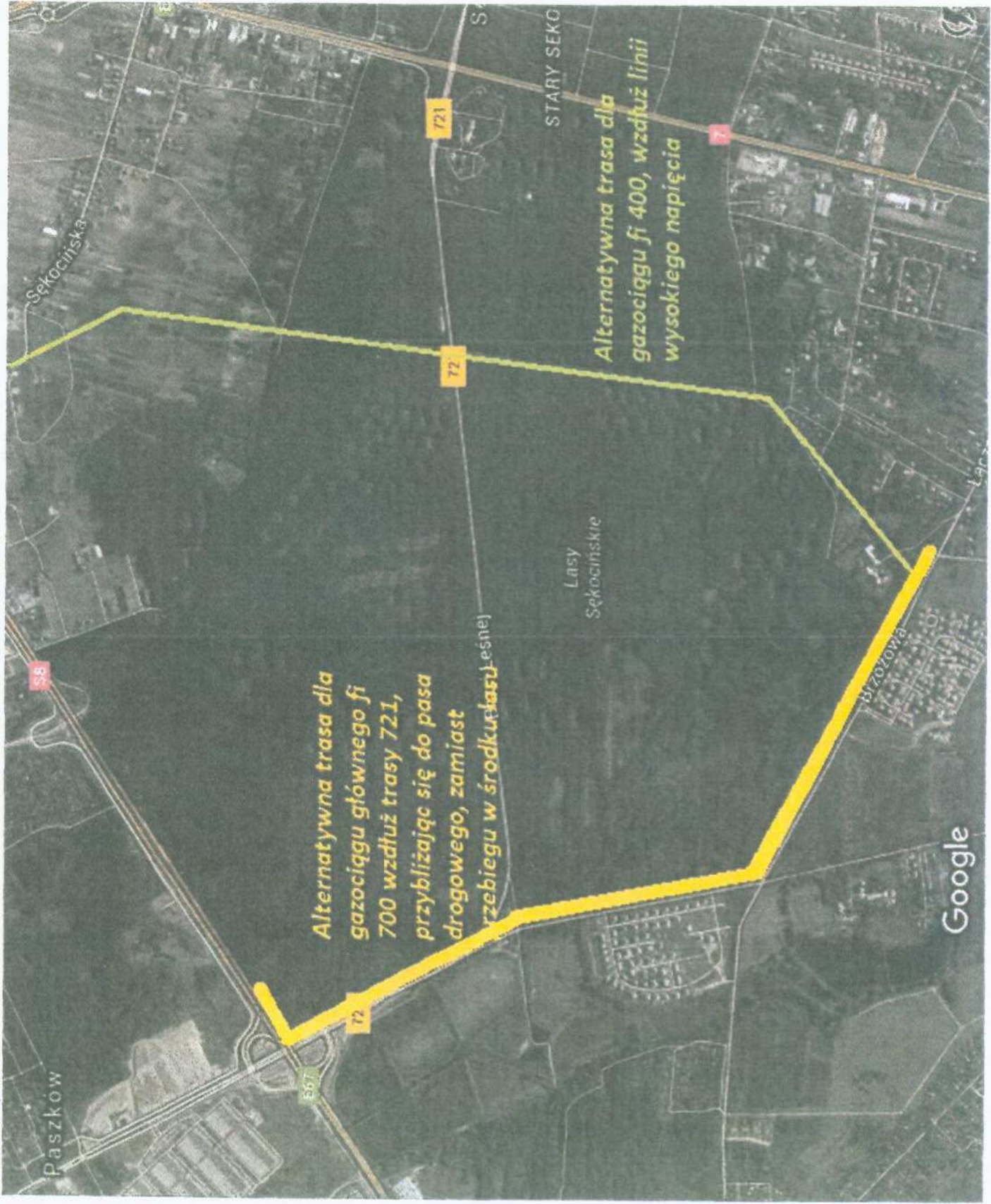
Mapka nr. 1