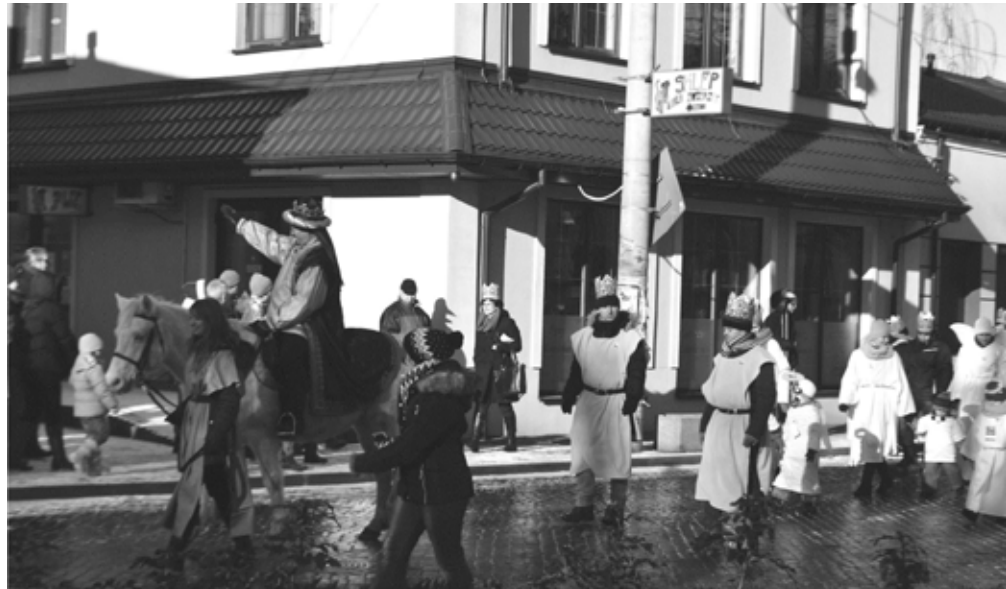
Przemarsz Orszaku przez Plac Poniatowskiego.

Rodzic ze Stowarzyszenia Rodziców Przedszkola i Szkoły Promienie oraz Szkoły Azymut NA FALI