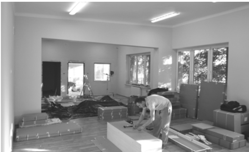
Fot. Żłobek w Ruści. Montaż mebli i sprzętów.

Trwają prace związane z budową dwóch garaży przy OSP w Młochowie (prowadzone są prace montażowe instalacji wod. - kan). Termin zakończenia prac przewidziany jest na 15 kwietnia 2015 r.