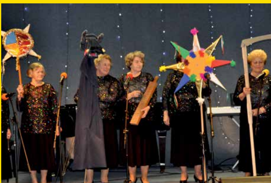
^ "Młodzi Duchem" - Laureaci Przeglądu Kolęd i Pastorałek w Pruszkowie