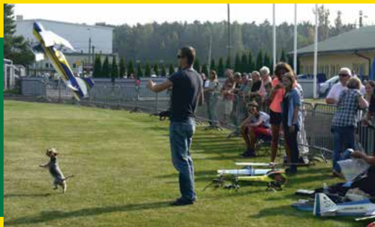
^ Pokazy zdalnie sterowanych samolotów