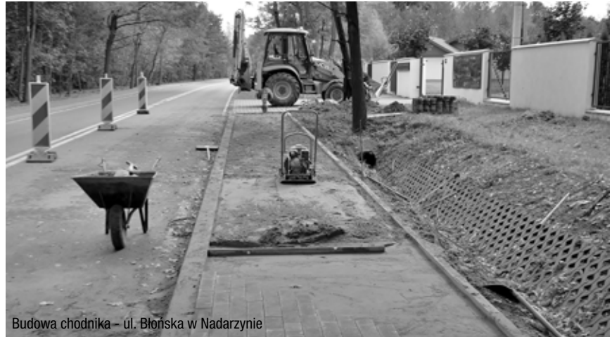
Budowa chodnika – ul. Błońska w Nadarzynie

Kontynuowana jest budowa kanalizacji przy ul. Wiosennej, Liliowej, Fiołkowej i Małwy w Nadarzynie . Rozpoczęły się prace związane z naprawą kanalizacji w Ruścu.