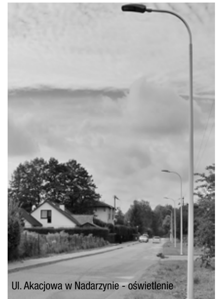
Ul. Akacjowa w Nadarzynie - oświetlenie

Nadal trwa przebudowa i rozbudowa budynku jednostki OSP Młochów o dwa garaże i zaplecze sa-