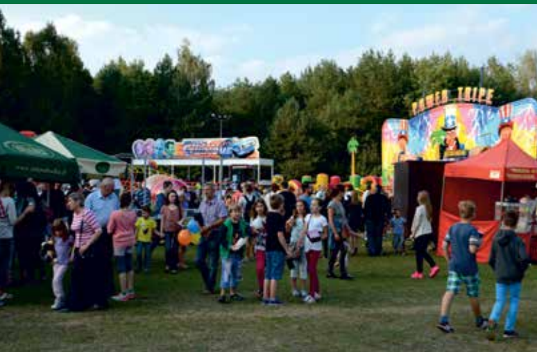
^ Atrakcje dla najmłodszych