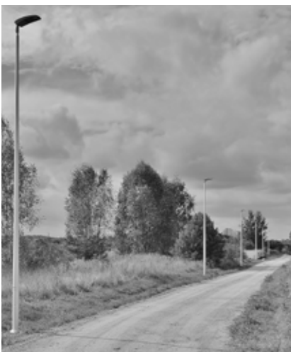
ul. Bukietowa w Walendowie - nowopowstałe oświetlenie.