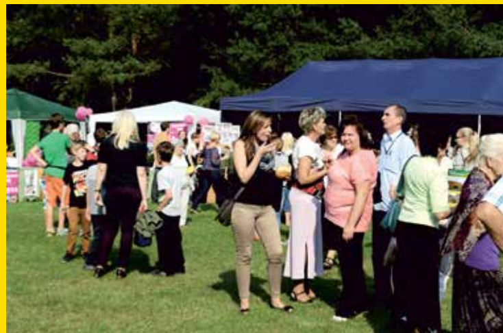
← Wystawy i stoiska