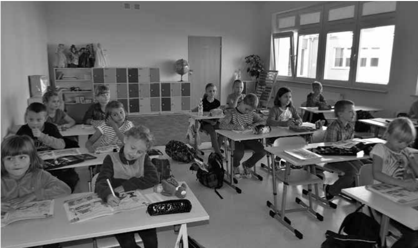
Uczniowie jednej z młodszych klas