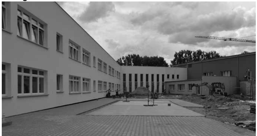
Powyżej: szkoła od strony wewnętrznego dziedzińca - prace związane z powstaniem chodnika i uporządkowaniem terenu.

Obecnie na ukończeniu są prace na elewacji budynku co nadaje szkole docelowych barw, w trakcie budowy jest realizowana przez PGE Dystrybucja stacja transformatorowa, z której zasilana będzie szkoła. Wznowiono prace drogowe i teren wokół szkoły nabiera ostatecznej formy. Trwa montaż oświetlenia zewnętrznego, kończy się montaż kotłowni, której rozruch nastąpi po wykonaniu wszystkich elementów przyłącza budowanego przez Zakłady Gazownicze (fot. poniżej).