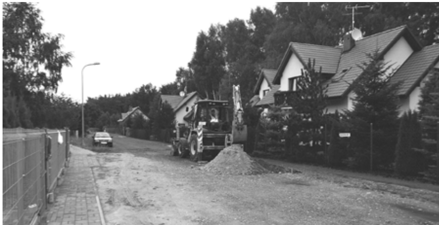
Budowa kanalizacji - ul. Liliowa w Nadarzynie

Budowa kanalizacji sanitarnej w Ruścu jest na etapie postępowania