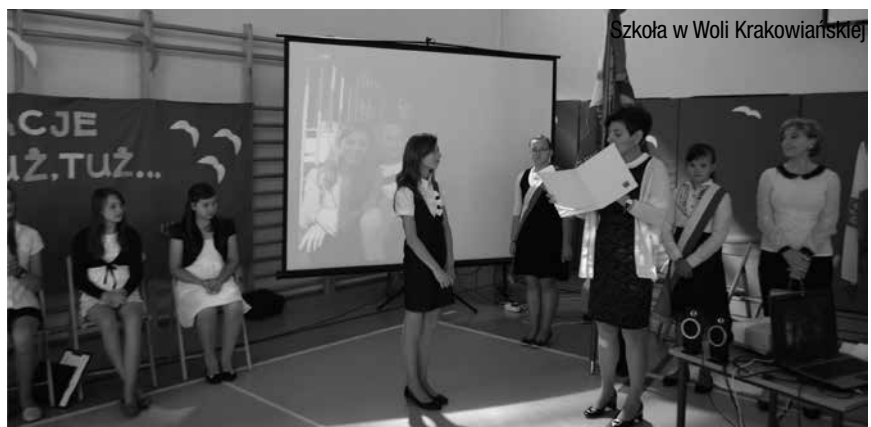
Szkoła w Woli Krakowianskiej