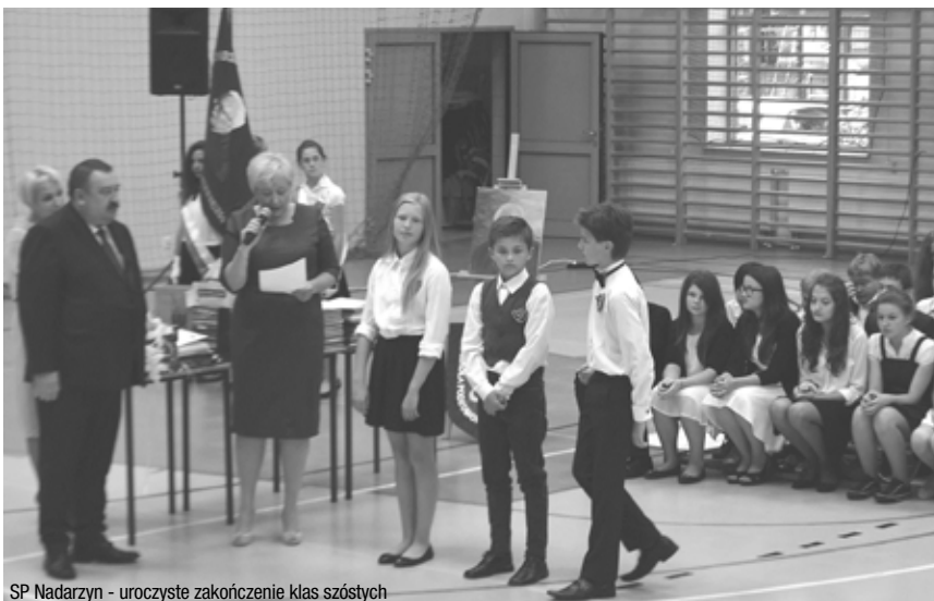
SP Nadarzyn - uroczyste zakończenie klas szóstych

renie gminy jest 5 publicznych szkół podstawowych oraz 1 niepubliczna, 3 przedszkola prowadzone przez gminę oraz 5 przedszkoli niepublicznych i jedno publiczne gimnazjum. Rok szkolny 2013/2014 zakończył się w Gminie Nadarzyn, podobnie jak w publicznych placówkach oświatowych w całej Polsce w dniu 27 czerwca. Uczniowie czekali na ten dzień z utęsknieniem 187 dni.