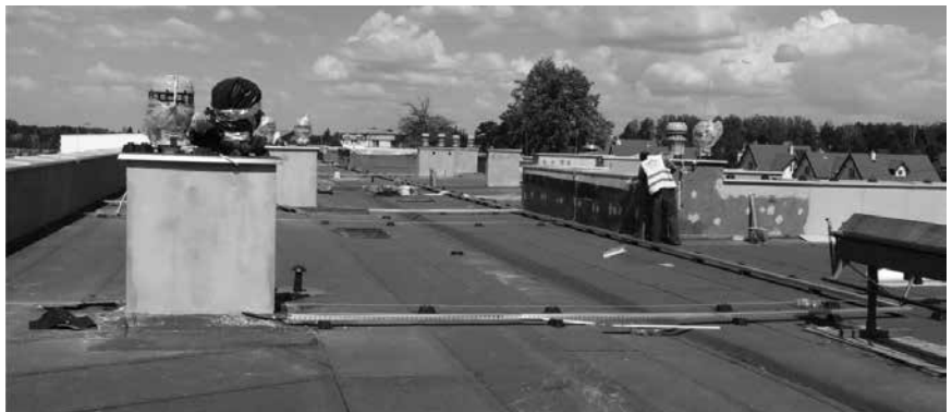
Prace końcowe na dachu budynku.