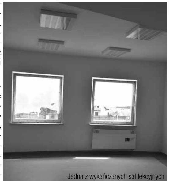
Jedna z wykańczanych sal lekcyjnych