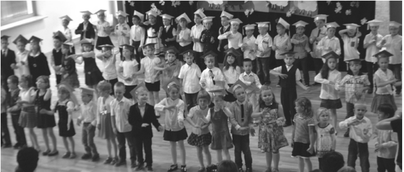
Zakończenie roku w PP Nadarzyn