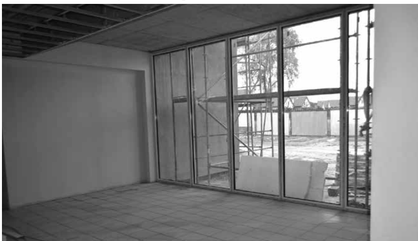
Główne wejście do szkoły

rzach trwa montaż stelaży dla sufitów podwieszanych oraz układana jest terakota, montowane są parapety wewnętrzne oraz glazura w sanitariatach. W trakcie montowania jest instalacja wentylacji mechanicznej w auli, kuchni oraz sali gimnastycznej. Układana jest instalacja elektryczna, teletechniczna i komputerowa.