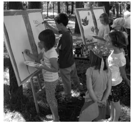
Piknik w Kostowcu

Do wspólnego świętowania z rodziną zaprosiły też szkoły pod-