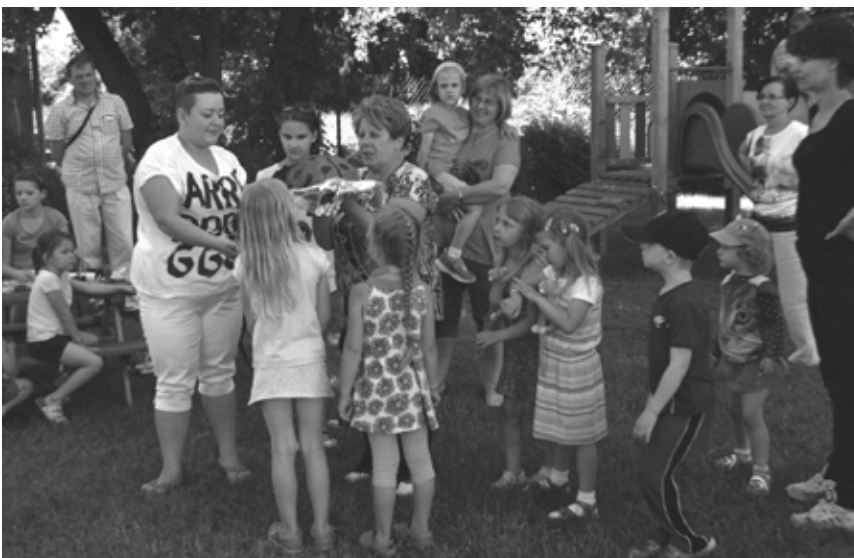
Powyżej: piknik w Wolicy. Jedna ze „słodkich” atrakcji dla najmłodszych - tort piknikowy w kształcie biedronki.

Mieszkańcy Gminy Nadarzyn znów pokazali klasę. Udowodnili, że nie tylko potrafią się bawić, spędzać wolny czas wspólnie z rodziną, wiedzą jak zachować zdrowie i utrzymać kondycję. Dla wielu była to czysta zabawa, forma wspólnego, rodzinnego spędzenia czasu.