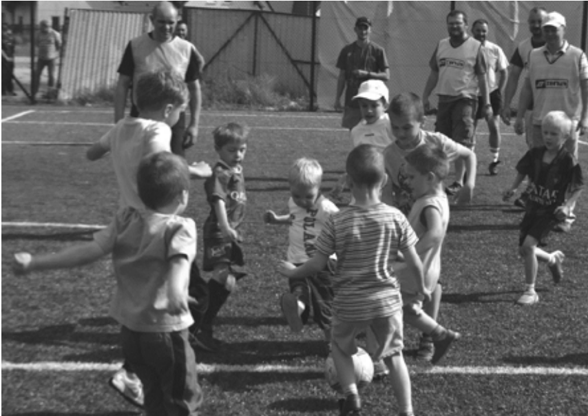
Piknik w Ruścu - piłkarskie zmagania...

klubu fitness GRAVITAN zatroszczyli się o najmłodszych organizując dla nich różne zabawy ruchowe.