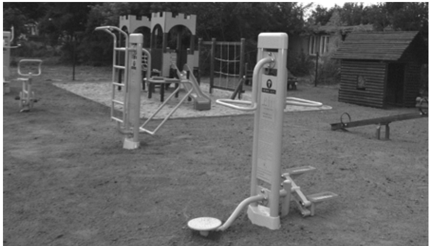
Gotowa jest już pierwsza siłownia w Wolicy - w najbliższym czasie mieszkańcy będą mogli z niej korzystać

Wkrótce do grona osób, które będą mogły korzystać z takiej formy czynnego wypoczynku na świeżym powietrzu dołączą również mieszkańcy Gminy Nadarzyn.