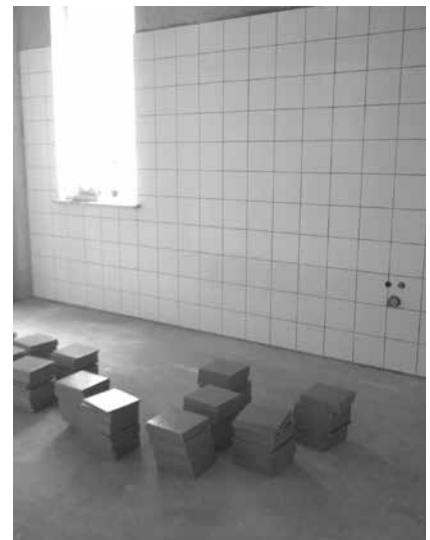
Pomieszczenia sanitarne - kładziona jest glazura

kładów na korytarzach przed aulą. Równocześnie na dachu wymieniana jest warstwa papy zabezpieczającej na docelowy system pokrywczy. Trwa kontynuacja prac związanych z elewacją na budynku (fot. powyżej). Trwa białkowanie ścian wewnątrz. W większości pomieszczeń zamontowano parapety wewnętrzne, a do zakończenia pozostało ostateczne malowanie i montaż wyposażenia. Na koryta-