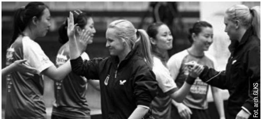
TARNOBRZEG 2013 - nadarzyńskie Wicemistrzynie (w ciemnych strojach) przed meczem o Mistrzostwo Polski