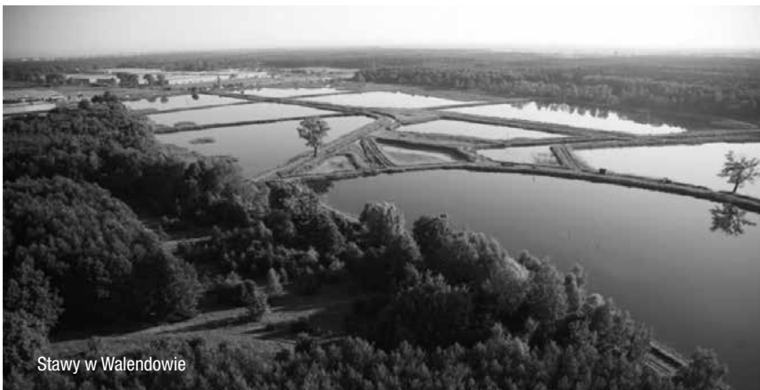
Stawy w Walendowie