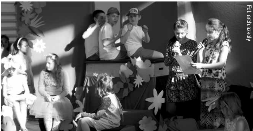
Artystyczna część powitania wiosny.

21 marca w naszej szkole zaczął się od niezwykle barwnego wiosenne go przedstawienia przygotowanego pod kierunkiem p. Kasi Krysiak, przez uczniów uczęszczających do świetlicy szkolnej.