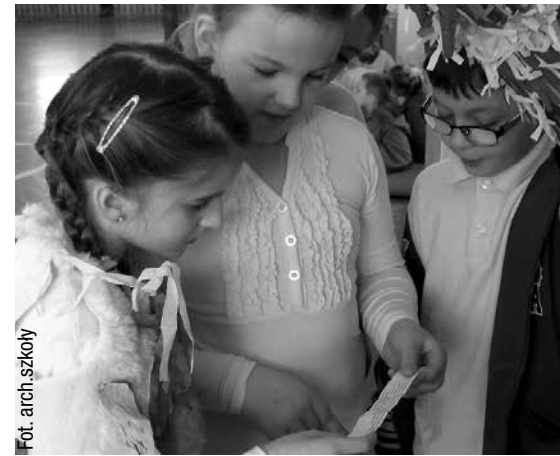
Rozwiązywanie zadań konkursowych

Umiejętność świętowania i związan z nimi zwyczaj, obrzędy i obyczaje