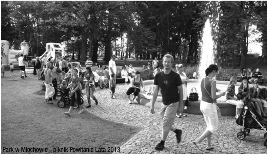
Park w Młochowie - piknik Powitanie Lata 2013

przeprowadzonej w 2009 roku park zachwyca swoim wyglądem. Występuje tu unikatowa roślinność, cenne gatunki starych drzew, z których kilka posiada status pomników przyrody. Także zabytkowe aleje lipowe. Na terenie parku znajdują się również stawy ze stanowiskami łowiskowymi, fontanna, trzyarkadowy XIX wieczny mostek oraz malowniczo położone wśród drzew i krzewów ścieżki spacerowe. Wykorzystując walory parku, organizowane są tam również liczne imprezy, pikniki, zawody sportowe, w których uczestniczą mieszkańcy gminy i okolic.