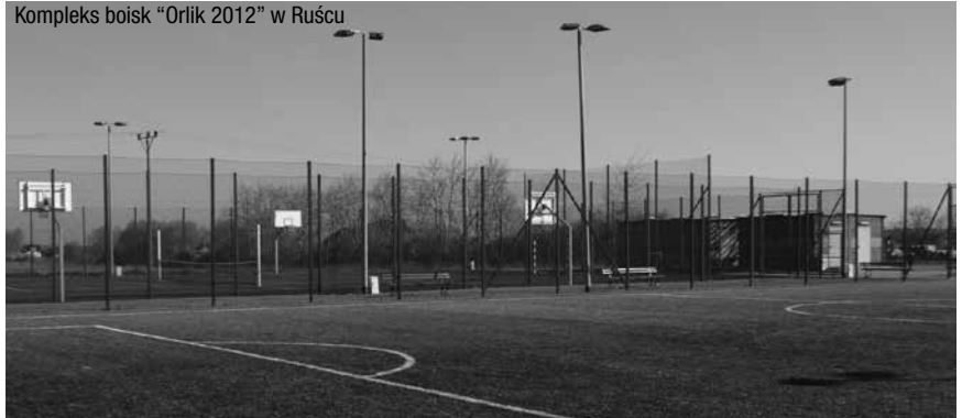
Kompleks boisk "Orlik 2012" w Ruścu

w Ruścu. Na ten cel wydano łącznie 596.126,72 zł