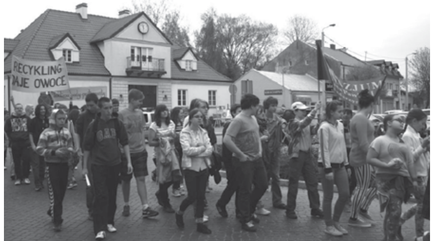
Nadarzyn maj 2013 r. - marsz ekologiczny organizowany od kilku lat, połączony z wystawami, konkursami o tematyce ekologicznej.

wiec – impreza skierowana do wszystkich placówek Gminy Nadarzyn biorących udział w Eko Top 2014.