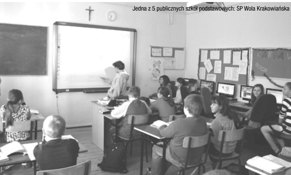
Jedna z 5 publicznych szkół podstawowych: SP Wola Krakowiańska

O fakcie tym przypomniał Wicewójt Gminy Nadarzyn Tomasz Muchalski także na łamach „Wiadomości Nadarzyńskich” w marcu 2013 r.: