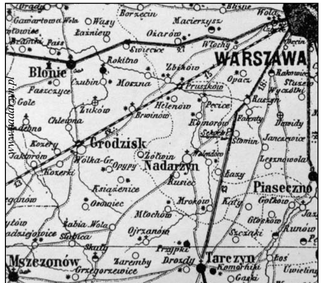
Mappa Królestwa Polskiego - M. Nipanicz, Warszawa 1863 miała miejsce potyczka z Moskalami 13 .

W 1863 r. wybuchło powstanie styczniowe. Okoliczne lasy stały się schronieniem dla powstańców. W pobliskim Młochowie