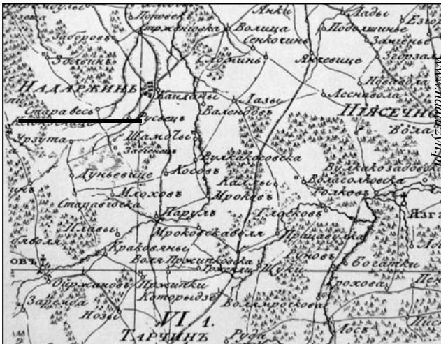
Semitopograficzeskaja Karta Carstw Polskogo - St. Petersburg 1811 r.

Po trzecim rozbiore Polski w 1795 r., Nadarzyn wchodzący ówczesnie w skład powiatu błoskiego znalazł się w obrębie zaboru pruskiego. W 1807 roku w wyniku wojen napoleońskich powstało Księstwo Warszawskie, które wzorem Francji podzielone zostało na departamenty. Nadarzyn, który do niego należał, znalazł się w departamencie warszawskim. W 1815 roku, po