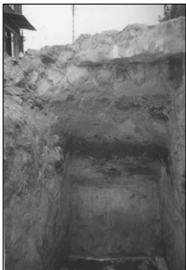
Pl. Poniatowskiego: pn. - zach. pierzeja przy posesji nr 29. Widoczna warstwa użytkowa z XVI - XVIII w. oraz poziom ulicy z XIX - XX w.

Podczas prowadzonych w 2004 roku badań archeologicznych pomiędzy wsiami Rusiec i Młochów (leżącymi na terenie obecnej Gminy Nadarzyn) odkryto liczne obiekty wskazujące na to, że już w epoce brązu tzn. ok. 1000 lat przed Chrystusem, istniało na tych ziemiach osadnictwo. Prowadzone wykopaliska wskazują, iż znajdowały się tu piece do jednorazowego wytopu żelaza tzw. dymarki z ok. I wieku n.e. Uważa się, że istniała tu osada należąca do Wielkiego Centrum Hutnictwa Metalurgicznego na Mazowszu, drugiego co do wielkości centrum hutnictwa na terenie Polski (po Górach Świętokrzyskich). 1