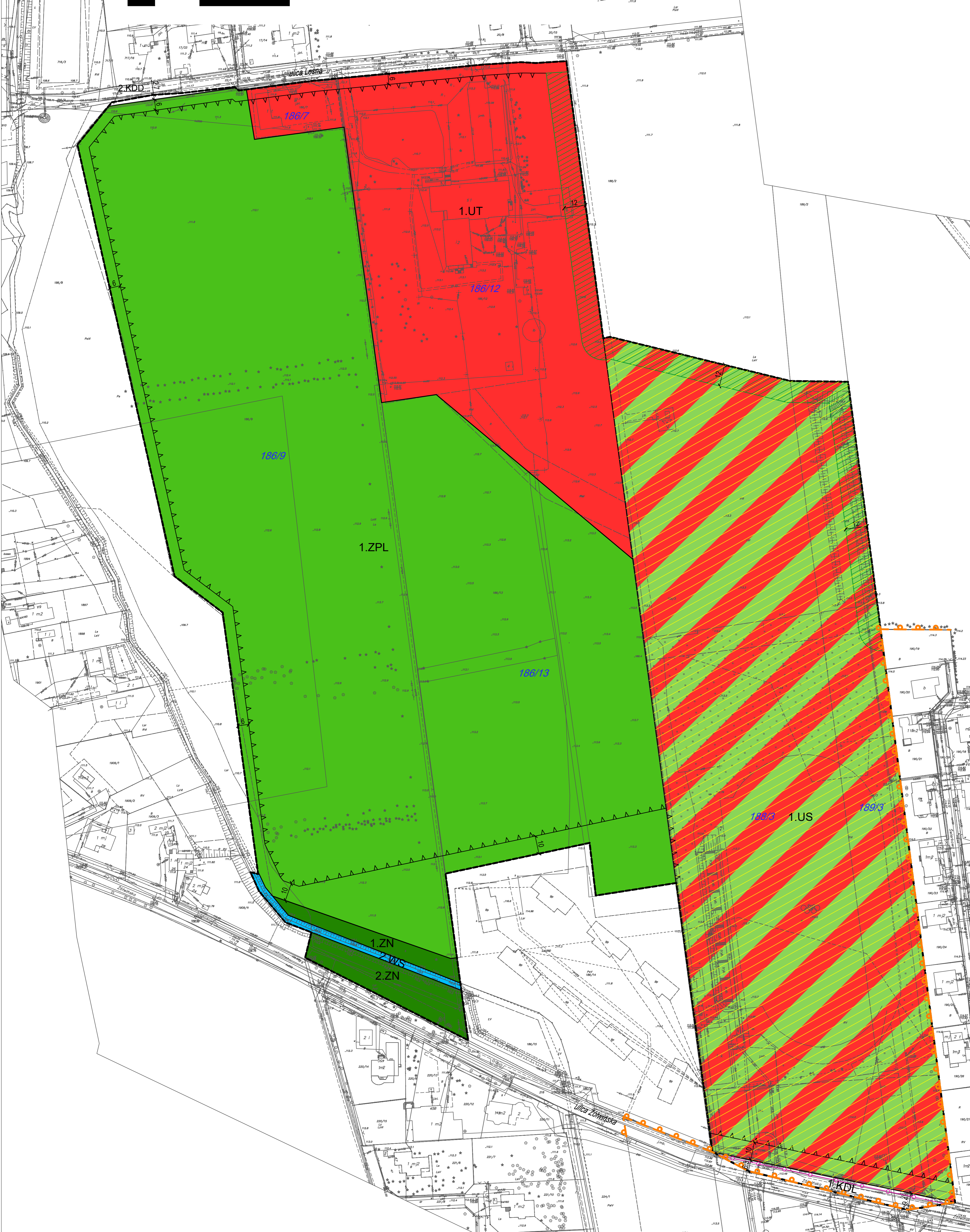
WYRYS ZE STUDIUM UWARUNKOWAŃ I KIERUNKÓW ZAGOSPODAROWANIA PRZESTRZENNEGO GMINY NADARZYN